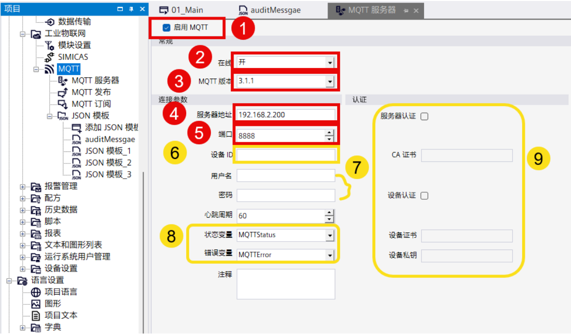
图 3.1.1MQTT 配置界面

可以在 SMART LINE 中通过脚本与系统函数选择 MQTT 的在线模式，也可通过变量控制该状态，如图②所示。